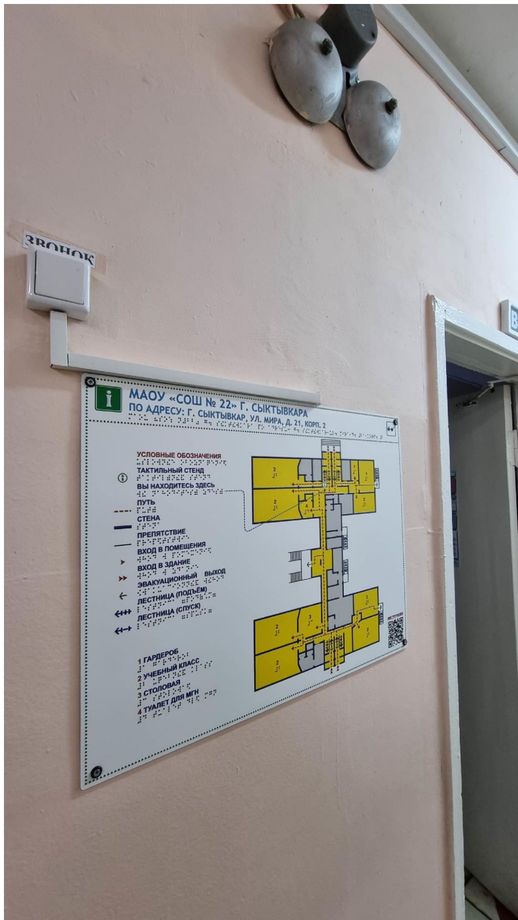
Фото №6. Мнемосхема на 1-ом этаже.