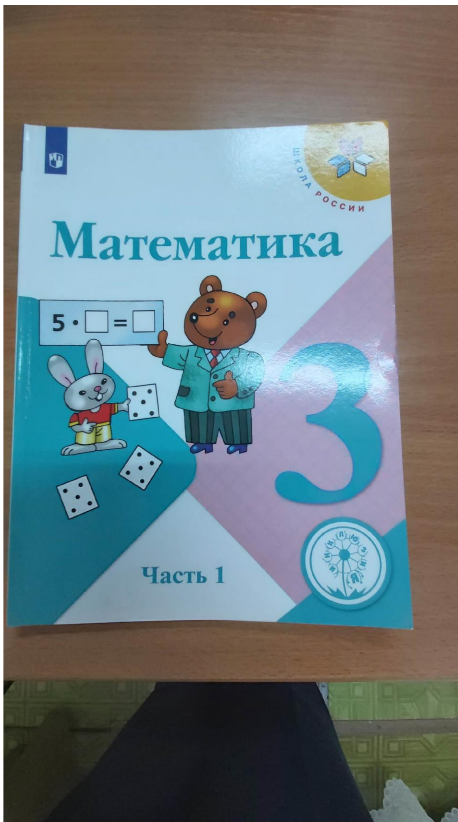
Фото №1. Учебник для слабовидящих.

и повышению уровня доступности образования для людей с инвалидностью и маломобильным группам населения (МГН) в период с 2018 по 2022 годы к паспортам доступности ОСИ №104 от 25.07.2018 года