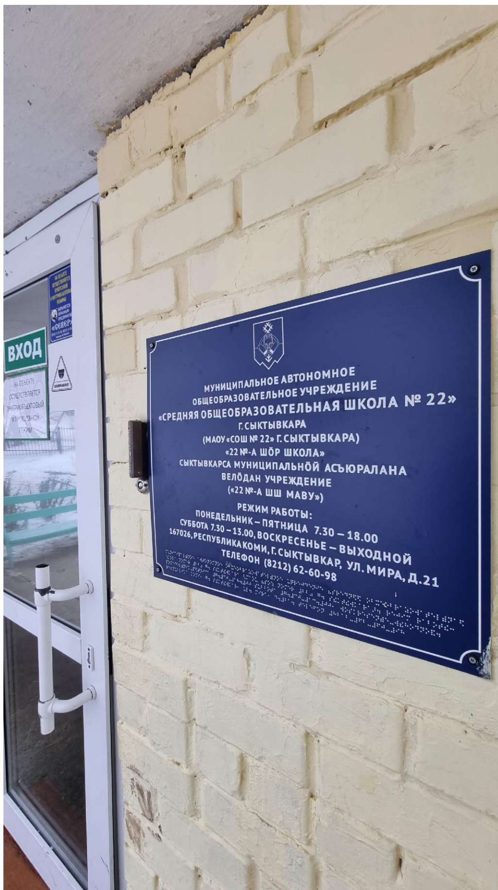
Фото №5. Табличка на входе в здание школы выполненная шрифтом Брайля.